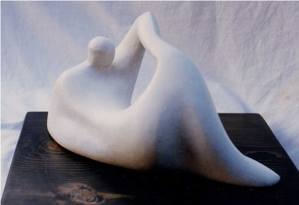
BAGNANTE - 1996 Terracotta cm. 15x30x20 Varano Borghi, Municipio