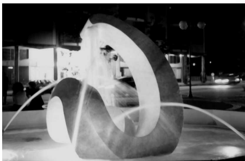
ONDA - 2000 Vetroresina, cm.300x300x300 Busto Arsizio, Piazza S.Michele Notturmo