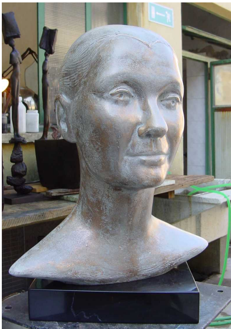
Ritratto di CARLA FRACCI, 2006 Gazoldo Degli Ippoliti, Collezione Museo d'Arte Moderna/Museo Delle Cere Inaugurazione presso il Museo d'Arte Moderna di Gazoldo: Autrice con Carla Fracci Realizzazione in bronzo presso la Fonderia Battaglia di Milano