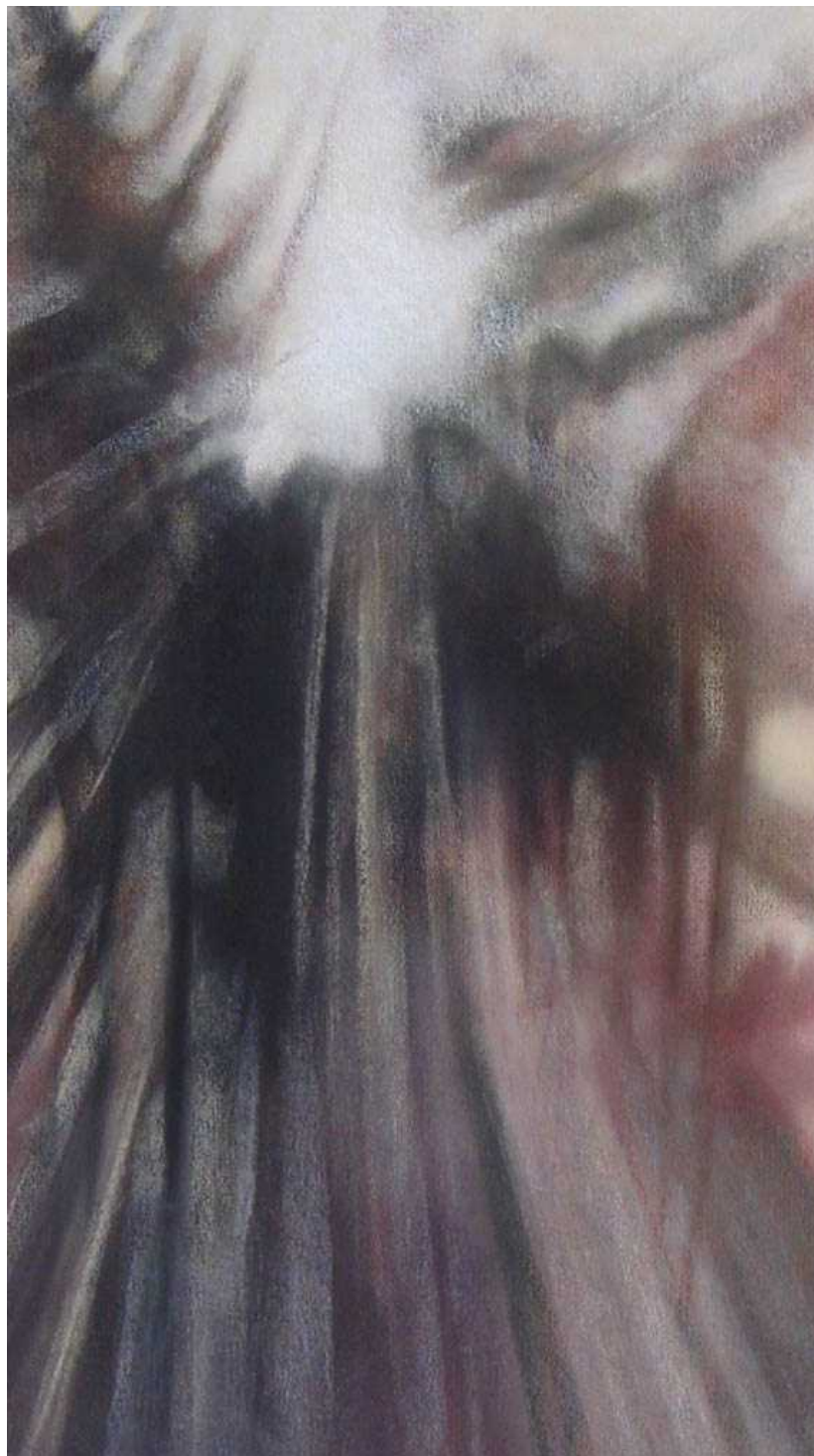
ANIMI VIRTUS - 2002 Pastello su carta, cm. 63x37 Maccagno, Collezione Museo Parisi Valle di Maccagno